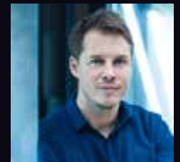
Dr. Stephan Sigrist Stratege und Gründer des Think Tanks W.I.R.E.

Es wird schmackhaft und an den verschiedenen Ständen gibt es vieles zu entdecken!